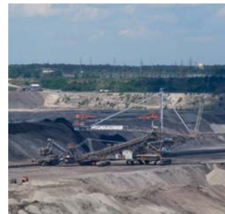
|| Kopalnia Belchatów