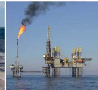
|| Platforma wiertnicza